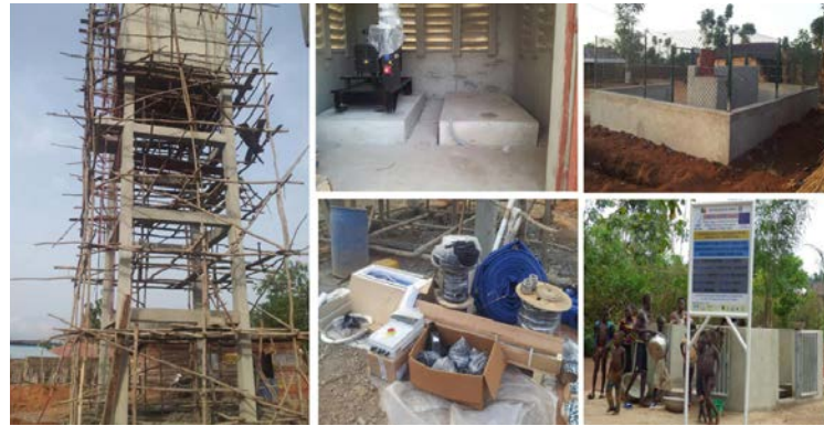
Lot n.1 - En construction

Dans le Lot 1 les travaux ont pour objet la construction d'un forage et d'un réservoir d'eau en béton armé, aérien de 40 m 3 sur une hauteur douze (12) mètres à Avagbé-Dédo dans l'arrondissement de Kpanroun.