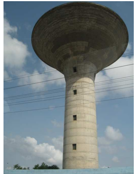
Château d'eau de Vèdoko recevant l'eau des forages de Calavi pour alimenter Cotonou