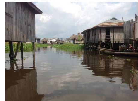
Eau pour le Tourisme