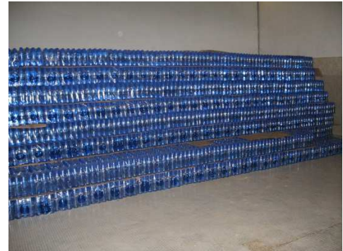
Eau pour l'industrie : Production de l'eau emboiteillée à Gomé

Rédaction d'un manuel technique pour conduire les administrateurs et les techniciens locaux à l'application pratique des indications prévues par la politique nationale de l'eau au Bénin (PANGIRE et SDAGE)