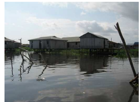
Etat de l'eau du lac Nokoué