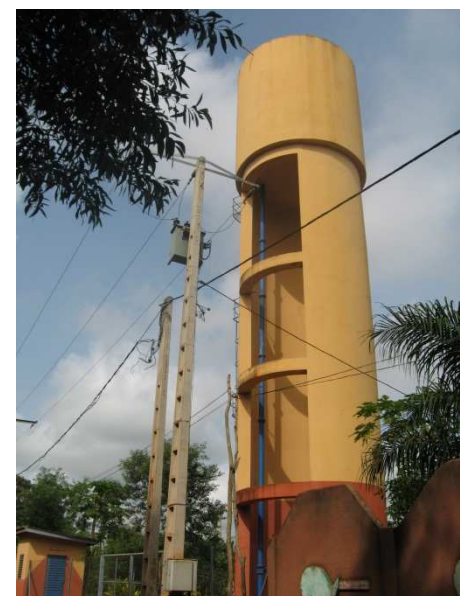
Château d'eau de l'AEV de Glo Djigbé