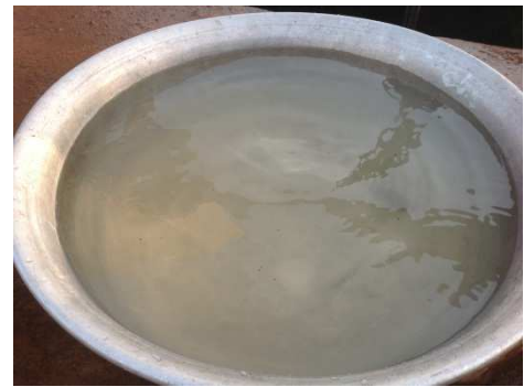
Aspect de l'eau de boisson issue des puits à grand diamètre

L'objectif spécifique que l'action vise est de réaliser des études et des actions pilotes dans la commune d'Abomey-Calavi visant à élaborer et tester sur le terrain un manuel technique pour la gestion des ressources en eau, en cohérence avec la législation nationale afin de proposer un modèle transférable de gouvernance locale de l'eau à travers la formation des techniciens locaux et des acteurs institutionnels impliqués dans le projet.