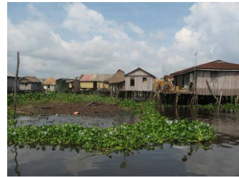
Habitat sur pilotis sur le lac Nokoué

Par ailleurs le projet a le but de développer les capacités à travers les activités de participation pour la sensibilisation des acteurs locaux et la résolution des conflits, afin de permettre le renforcement du consensus institutionnel.