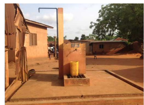
Borne fontaine à Glo Djigbé