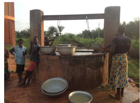
Puits à grand diamètre